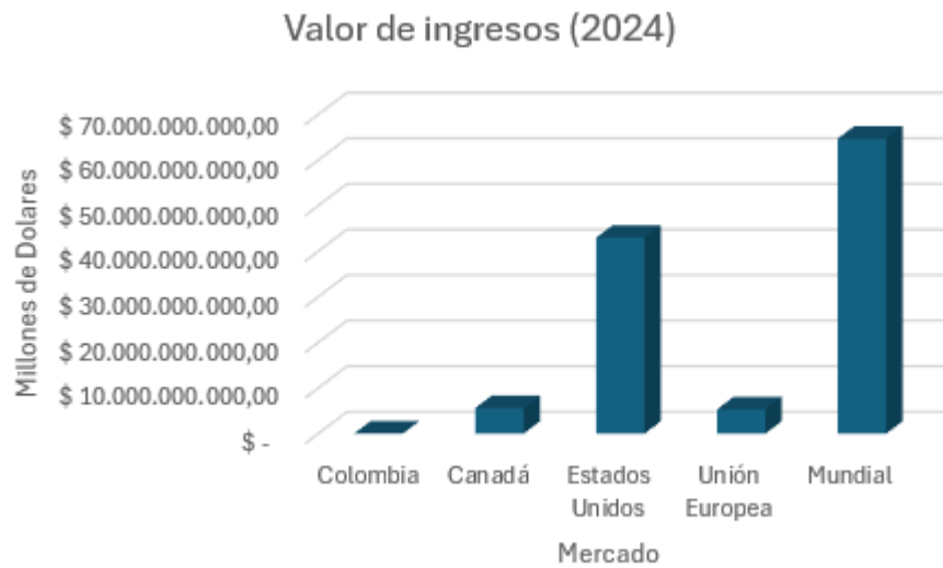
Valor de ingresos mercado del cannabis

Nota: La figura representa ingresos del mercado del cannabis en el año 2024