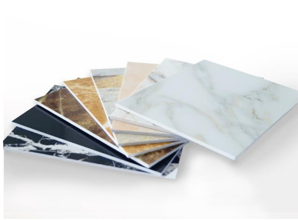
Lámina de PVC tipo mármol

Nota. Fotografía de láminas de PVC de tipo mármol.